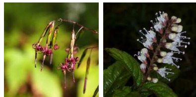
クサヤツデ と シモバシラ