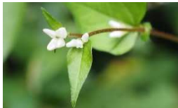
ミゾソバの変種 ヤマミゾソバ